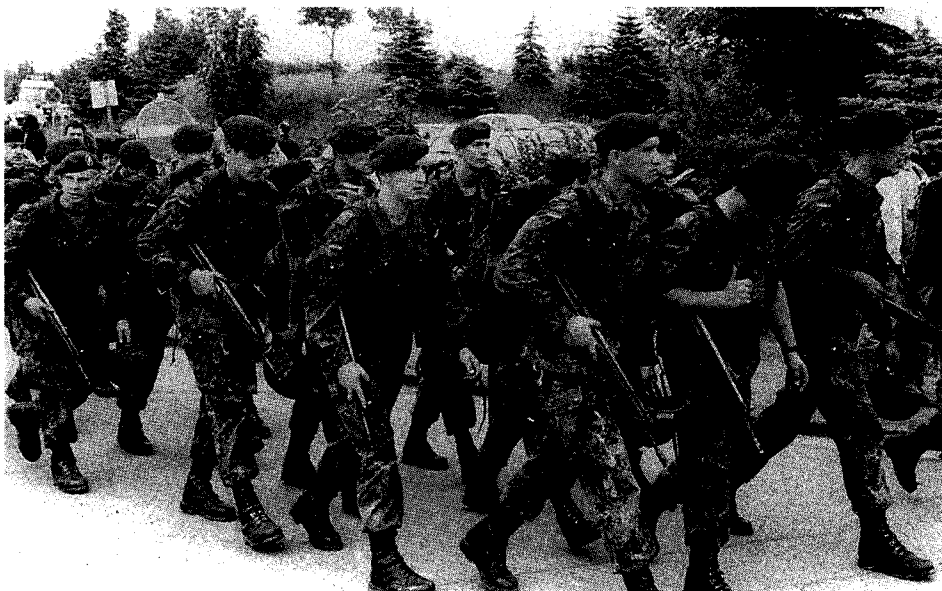
...bei einer Übung der Saarlandbrigade

* Allied Command Europe Mobile Force **Rapid Reaction Corps