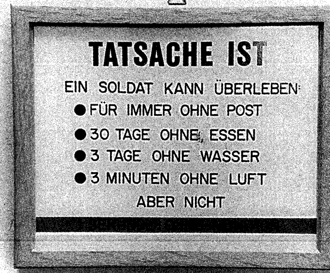
Tag der Offenen Tür, Kaserne 'Auf der Ell' Merzig 29.5.1994

Die Kasernen der Saarlandbrigade in Saarlouis und Lebach, wenige Kilometer von der französischen Grenze entfernt, sind nach 'erfolgreichen' deutschen Militärs aus dem deutsch-französischen Krieg 1870/72 benannt. General August Graf von Werder (Saarlouis) war verantwortlich für die sechsstägige Belagerung und Bombardierung mit Artillerie der Stadt Straßburg und der Ermordung vieler Zivilisten. General Gottlieb Graf Haeseler (Lebach) zeichnete für die Einschließung der Festung Metz verantwortlich. Damit war die angestrebte Annexion von Lothringen und Elsaß besiegelt.