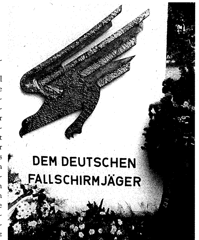
Gedenktafel bei der Saarlandbrigade. Kein Wort, daß deutsche Fallschirmjäger im 2. Weltkrieg andere Länder und Städte angriffen. Merzig, Mai 94