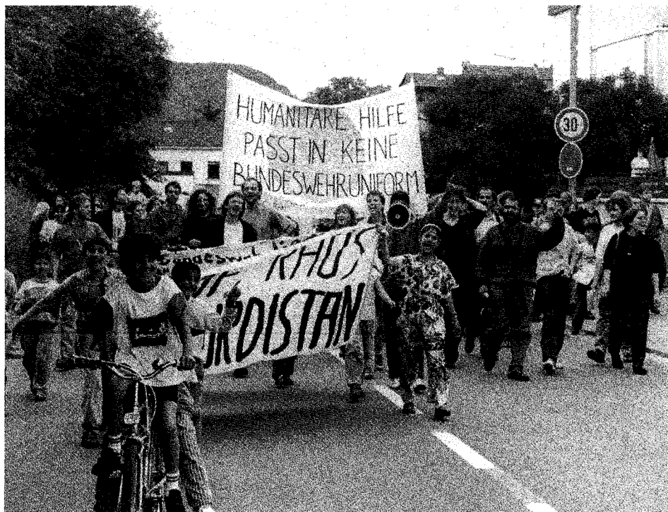
Demonstration gegen das öffentliche Gelöbnis der Saarlandbrigade am 18.5.1993 in Merzig.