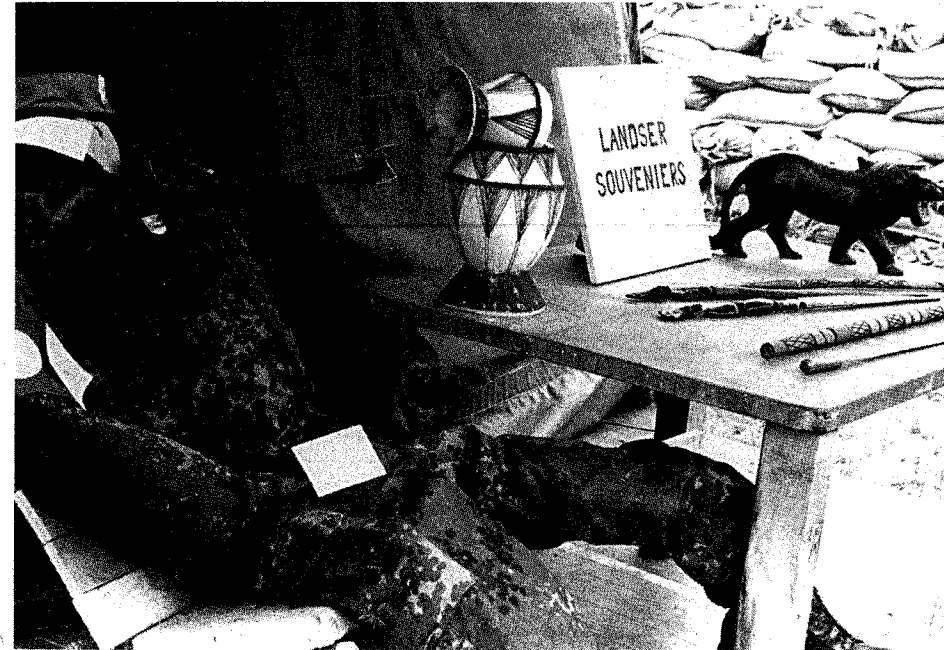
Darstellung des Somalia Einsatzes. Entdeckt beim Tag der offenen Tür in der Merziger Kaserne 'Auf der Ell' Merzig 29.5.1994.

handlungstisch und dreht stattdessen an der Gewaltspirale. Die AKTION 3. WELT Saar plädiert für einen sofortigen Stop der Militärkumpanei und für Verhandlungen.