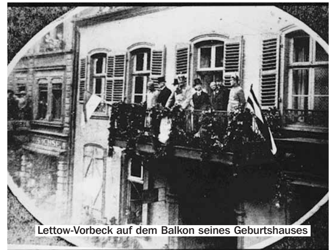
Lettow-Vorbeck auf dem Balkon seines Geburtshauses

bauer, Horst Janson) die im Januar und Februar 2007 im ZDF gezeigt wurden. Beide Filme pflegen das koloniale Klischee und das Bild von unmündigen Afrikanern und Afrikanerinnen, die dementsprechend auch nur, neben der schönen Landschaft und den wilden Tieren, die Kulisse bilden dürfen und als Statisten mitspielen. Die Helden sind weiße Männer und Frauen. Ganz wie in den „guten alten Zeiten“ des „ritterlichen, unbesiegt“ Helden, General Paul von Lettow-Vorbeck. Hierzu passt auch, dass das kolonialverherrlichende Lied „Wie oft sind wir geschritten auf schmalem Negerpfad“ bis heute in dem bekannten und weit verbreiteten Liederbuch „Der Bettelmusikant“ abgedruckt wird. (9) Aus unserer Sicht gibt es nichts am Kolonialismus und „nichts an der Person Lettow-Vorbecks, das heute noch verehrungswürdig wäre“ (10) oder gar Vorbildfunktion hätte.