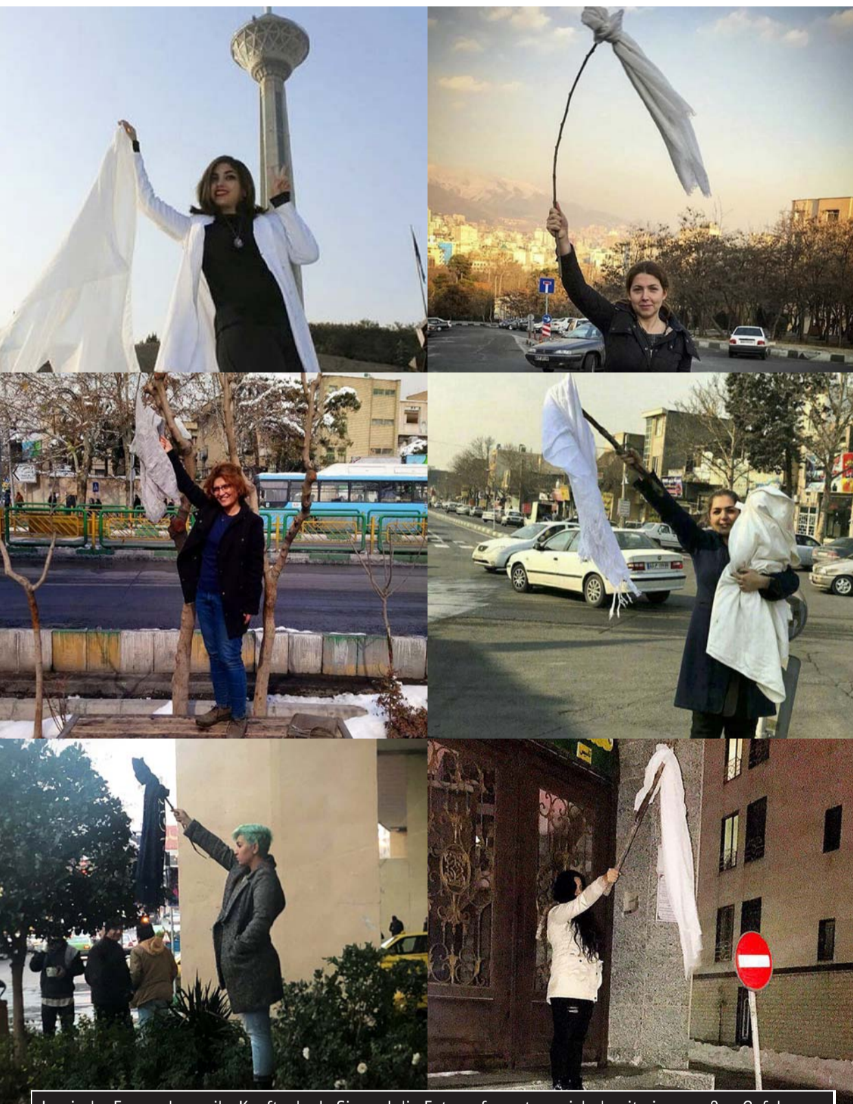
Iranische Frauen legen ihr Kopftuch ab. Sie und die Fotografen setzen sich damit einer großen Gefahr aus.

Von manchen Muslimen wird der Jihad zwar als geistig-spiritueller Bemühen verstanden, doch entspricht dies nicht dem vorrangigen Verständnis der Islamisten. Zweck des Jihad ist es, den Nichtmuslimen ihre Auffassung des Islam aufzuzwingen und die ganze Welt dem "einzig wahren Glauben" zu unterwerfen. Dabei ermorden "Heilige Krieger" gezielt auch unbeteiligte Zivilisten. Häufig tun sie dies mittels Selbstmordattentaten, ihr eigenes Leben bedeutet ihnen nichts.